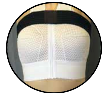
SISTEMI DI COMPRESSIONE

LE AZIENDE DI INDUMENTI PER COMPRESSIONE DIVIDONO IL PERIODO DI RECUPERO POST CHIRURGICO IN DUE FASI :